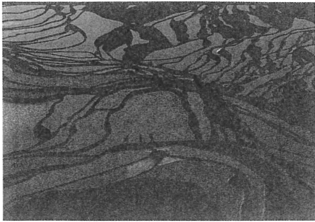
写真 中国棚田の3人の農夫