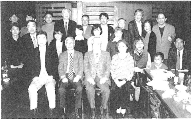
写真 2019年3月9日に開かれた関東良陵若手会。有益な親睦を行った若手と先輩先生方の和やかな集合光景 (会場・居酒屋・北海道 飯田橋)

そうした意味で、新型コロナウイルス感染が治まれば、できるだけ早急に若手会を再度開きたいと思っています。若手とベテランの参加をまた期待しています。