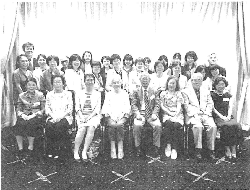
写真 令和元年(2019年)7月6日(土)に盛大、華やかに開催された関東良陵同窓会・女性医師部会に出席の先生方(於・外国人記者クラブ・東京丸の内)

また皆様と楽しいひと時を過ごすことを楽しみにしております。くれぐれも、ご健康にはご留意ください